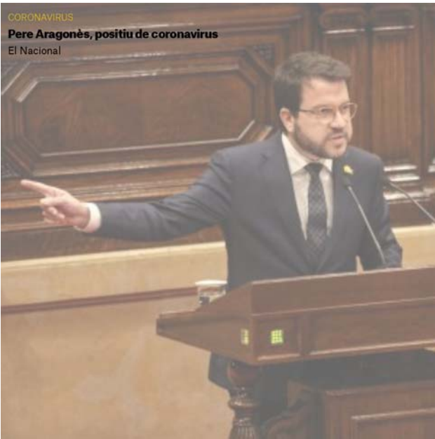
CORONAVIRUS Pere Aragonès, positiu de coronavirus El Nacional