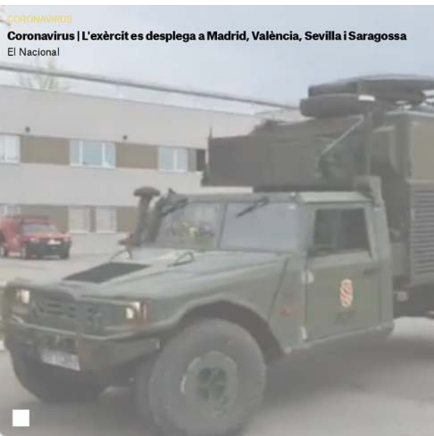
CORONAVIRUS Coronavirus | L'exèrcit es desplega a Madrid, València, Sevilla i Saragossa El Nacional